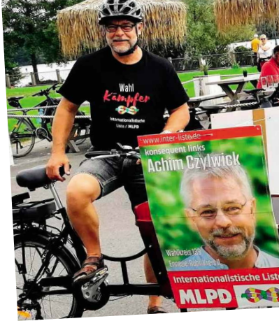
Fahrrad-Rundtour um den Kemnader See

Ich würde mich freuen, von Ihnen / von euch zu hören! Achim Czyliwick